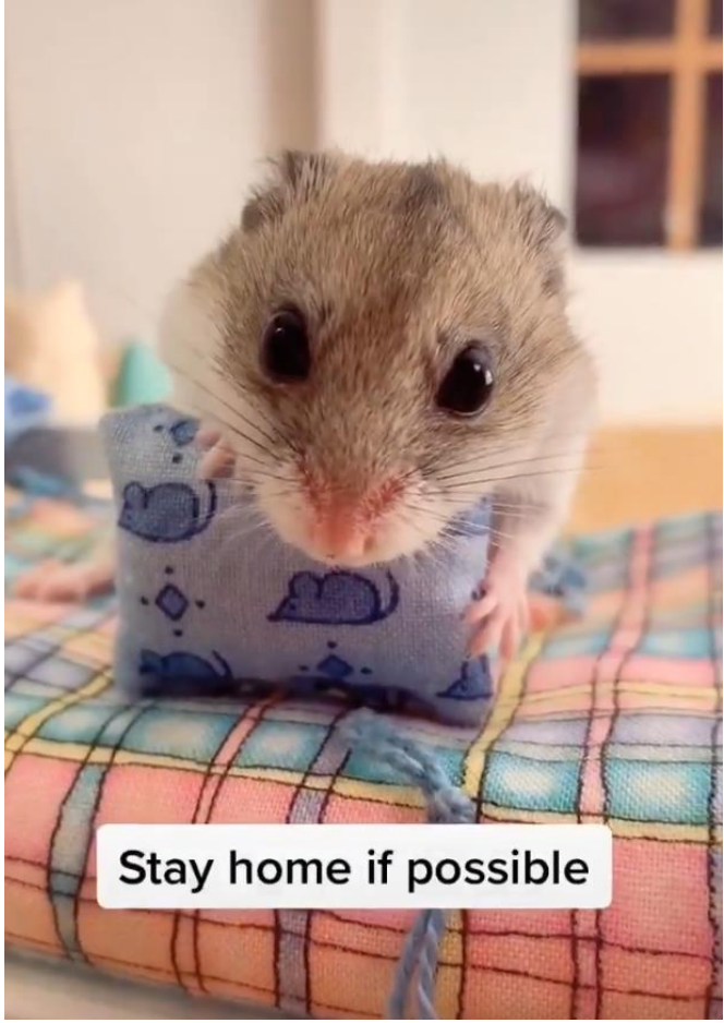
Stay home if possible