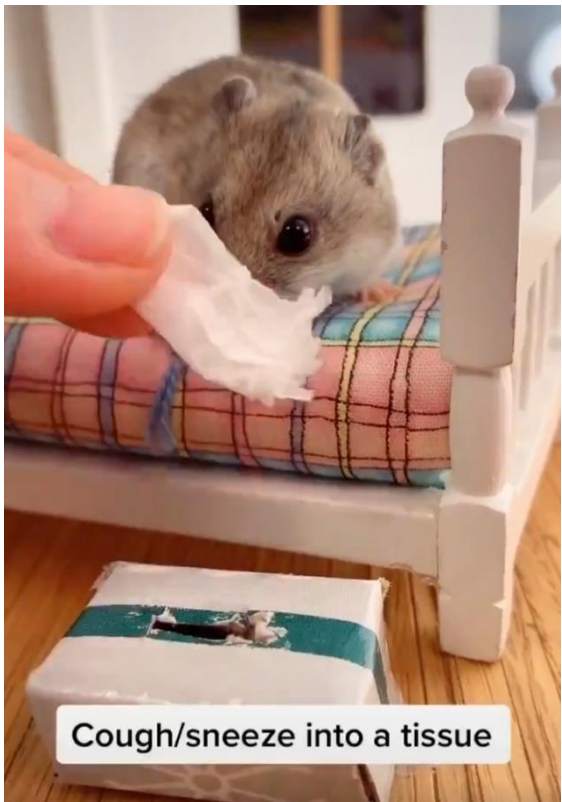
Cough/sneeze into a tissue